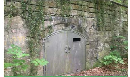
Historischer Eiskeller Eislager der ehemaligen Nöthnitzer Brauerei