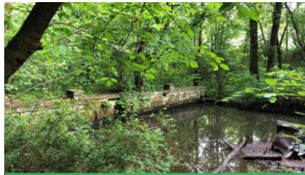
Altes Possendorfer „Bad Eicheleite“ Bis zum Hochwasser 1958 in Betrieb Sichtbar: Einstieg und Startblöcke

Die besondere Lebensqualität, die in einer Stadtrandgemeinde erwartet wird, zählt sicher zu den Hauptgründen.