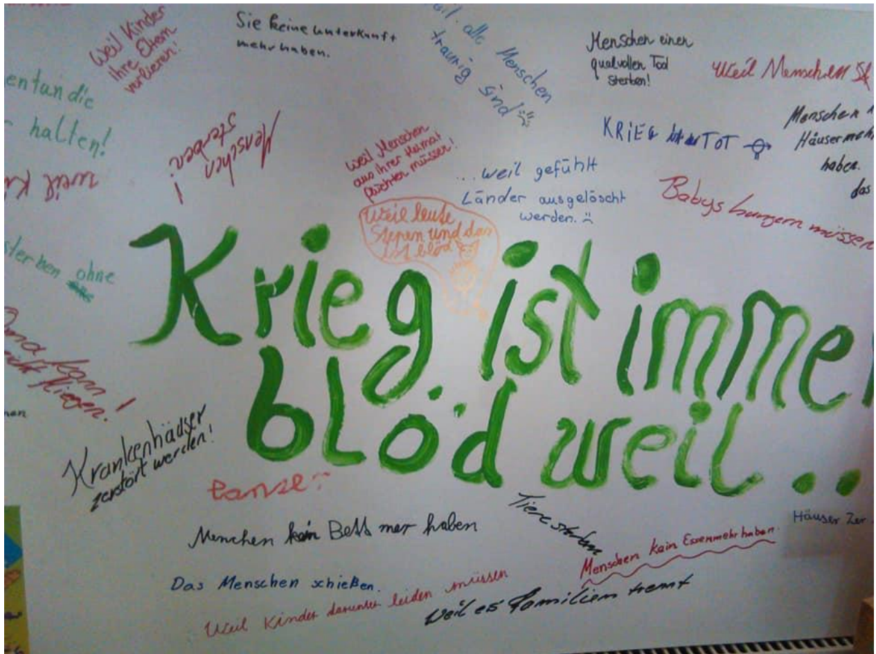
Tolle Arbeit im Röhrsdorfer Club95. Gedanken zum Frieden.